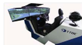
制御する：性能・官能評価をStatic Simulatorで実現