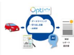
つなぐ：計測から解析をクラウドを用いて自動化