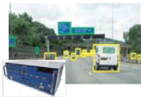
はかる：自動運転開発を支える車載計測