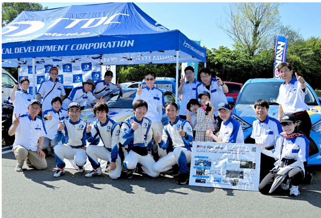
サービスパークで集合写真