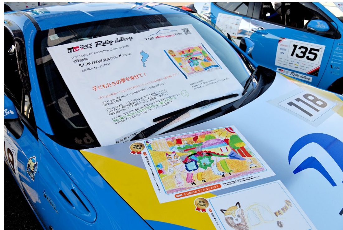
子どもたちの夢を乗せて！ 社員の子どもたちが描いてくれたイラストと一緒に 走りました！